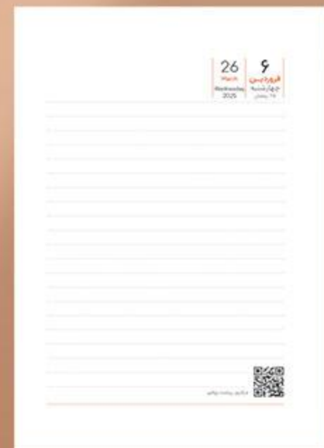
• یونیفرم سررسید یک هشتم