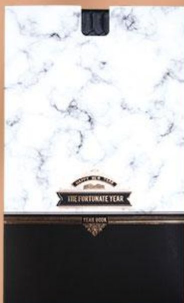
• جعبه سررسید اروپایی