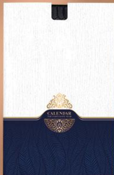
• جعبه سررسید رقی