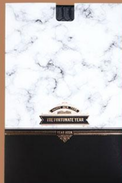
• جعبه سررسید وزیری