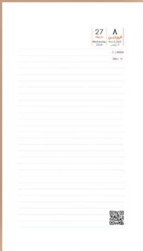
• یونیفرم سررسید اروپایی