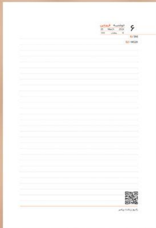
• یونیفرم سررسید رقی