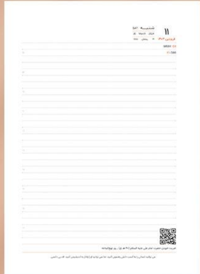
• یونیفرم سررسید وزیری